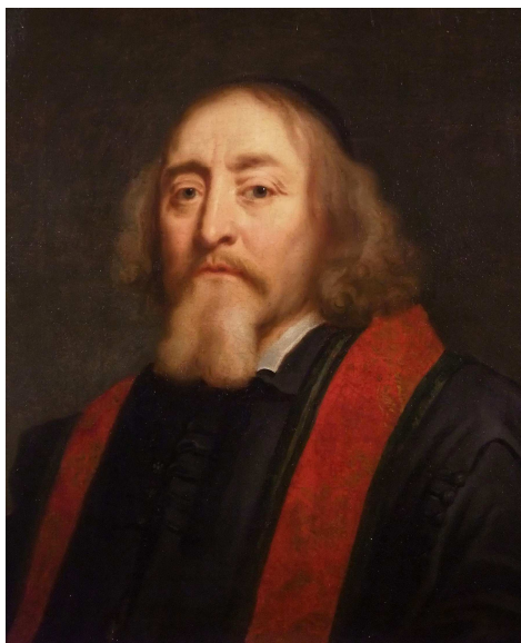
Jurriaan (of Jürgen) Ovens (1623-1678): Portret van Jan Amos Comenius, (1650/70) olieverf op doek, 64x56 cm, Rijksmuseum, Amsterdam (nu in Comenius Museum Naarden)