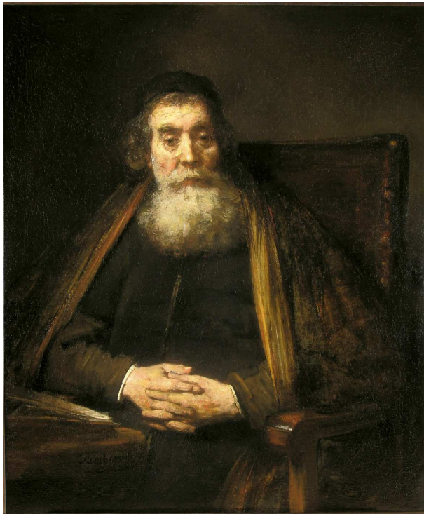
Rembrandt van Rijn (1606-1669): Portret van Jan Amos Comenius, (ca. 1660) olieverf op doek, 104x86 cm, Galleria degli Uffizi, Florence