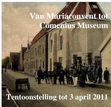
Van Mariaconvent tot Comenius Museum