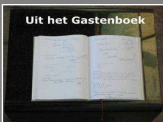
Uit het Gastenboek

. . . van de Gemeente Naarden, dd. 27 oktober 1992 betreffende het plaatsen van sanitaire voorzieningen buiten het museum t.b.v. het grote aantal Tsjechoslowaakse bezoekers.